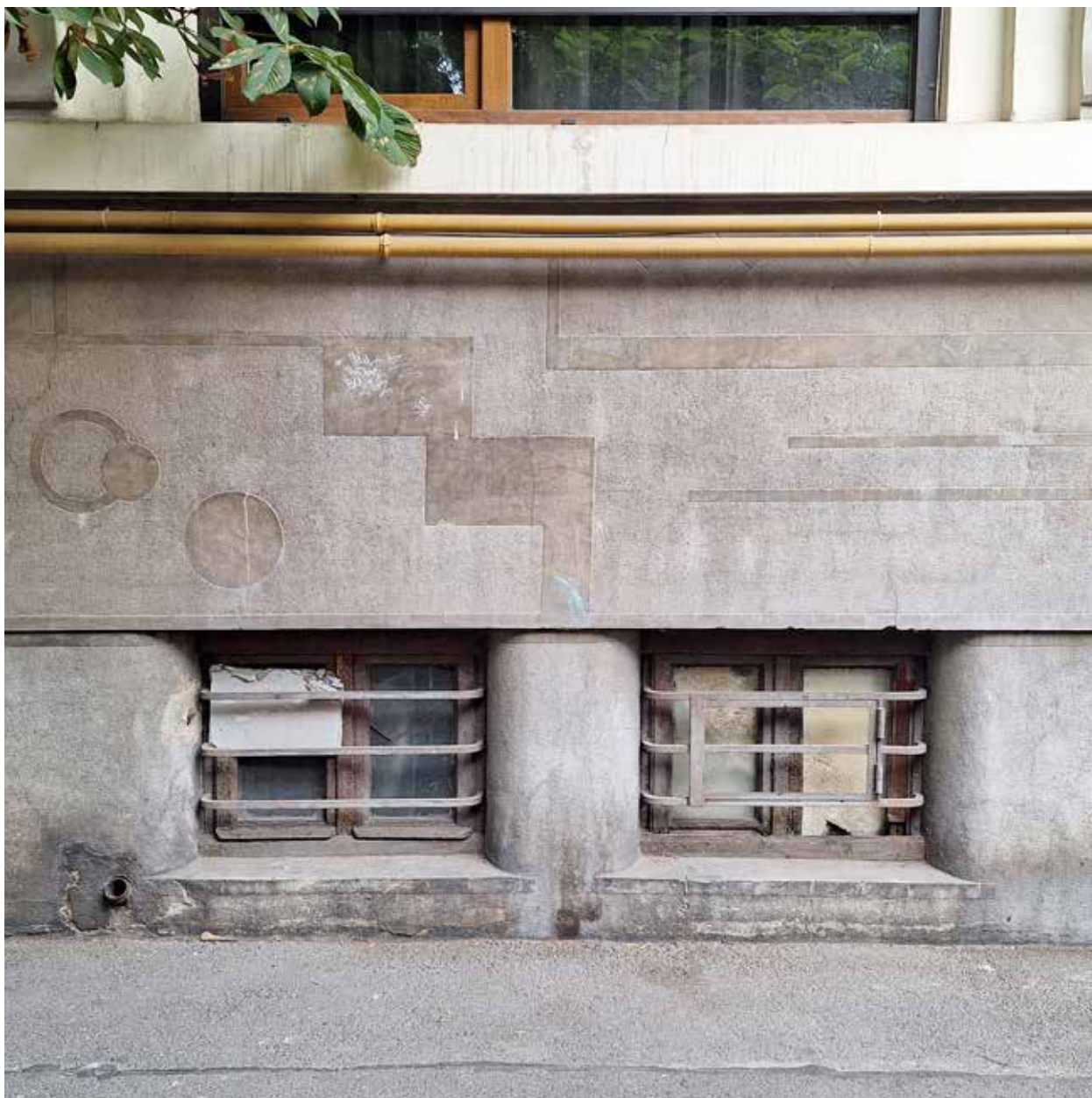
Detaliu de soclul, București.