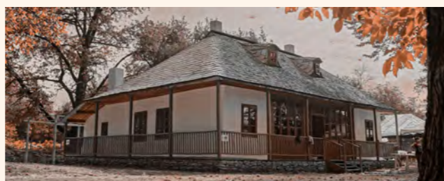
Casa George Enescu, Mihăileni © Camil Iamandescu

Casa a aparținut mamei lui George Enescu, Maria Cosmovici, și a fost construită de părinții acesteia cel mai probabil pe la mijlocul secolului al XIX-lea. În prezent, casa este redată comunității locale sub forma unui centru cultural și educațional. În 2020 s-au finalizat lucrările de restaurare, moment marcat și prin inaugurarea unuia dintre cele mai ambițioase proiecte ale Fundației Pro Patrimonio, „Academia de muzică și studiul sunetului”.