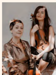
Les Violons d'Ingres