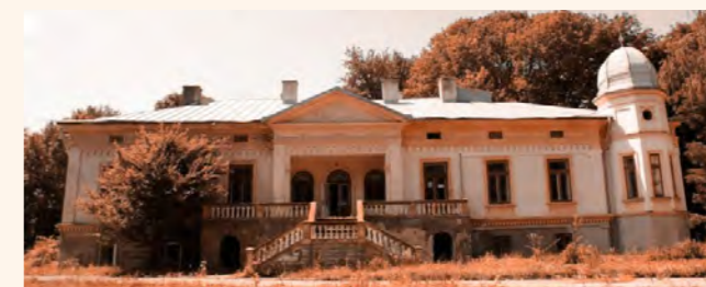
Conacul Moruzi, Vârfu Câmpului

Conacul Moruzi din Vârfu Câmpului este aproape de râul Siret și se află într-o curte parc formată dintr-o rezervație de stejari seculari. Frumusețea locului este una cu totul aparte și poate crea un cadru scenografic unic pentru evenimente culturale: concerte, ateliere, conferințe.