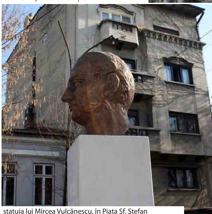
statuia lui Mircea Vulcănescu, în Piața Sf. Stefan