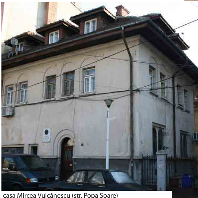
casa Mircea Vulcănescu (str. Popa Soare)