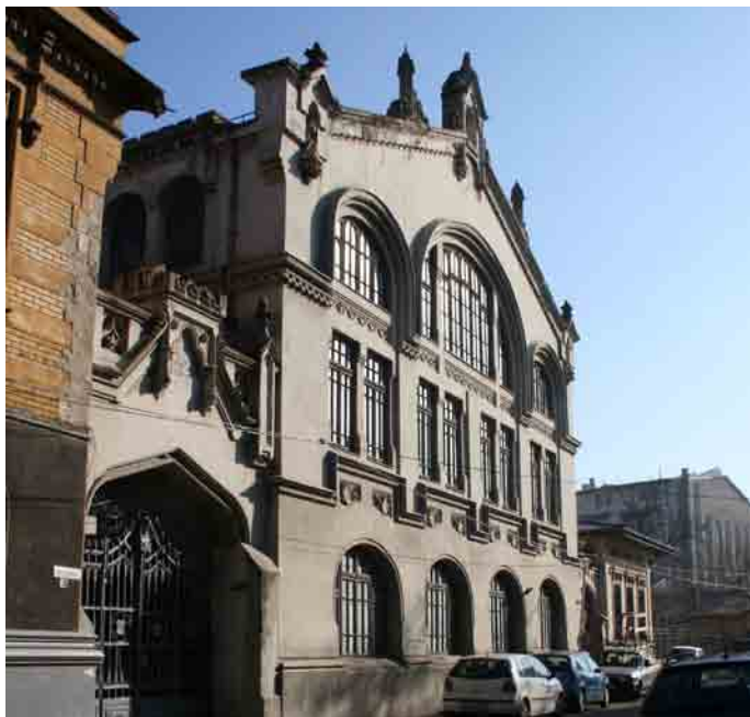
garajele Frații Rieber