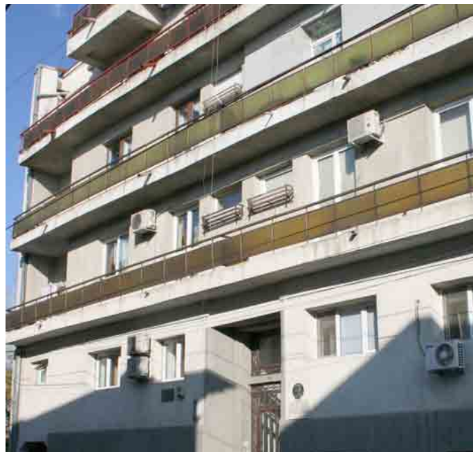
locul în care a fost casa lui Panait Istrati