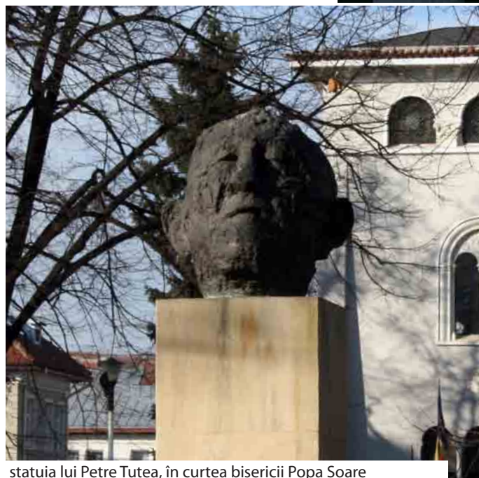
statuia lui Petre Țuțea, în curtea bisericii Popa Soare