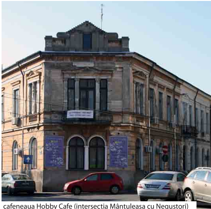
cafeneaua Hobby Cafe (intersecția Mântuleasa cu Negustori)