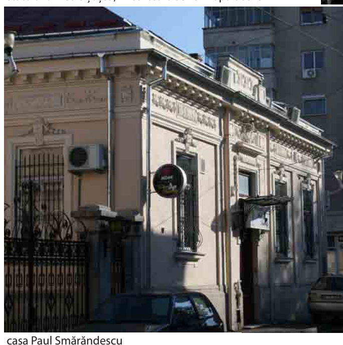
casa Paul Smărăndescu