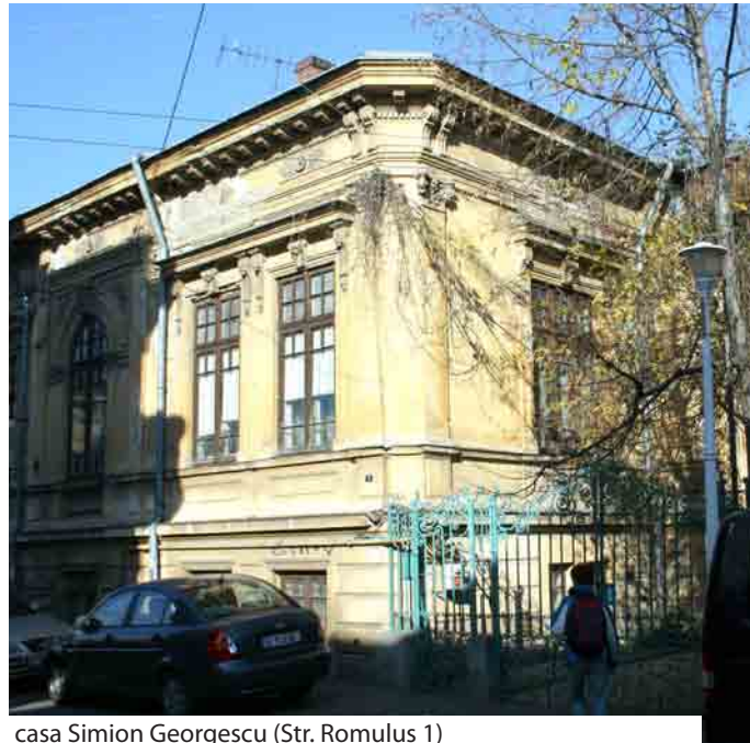
casa Simion Georgescu (Str. Romulus 1)